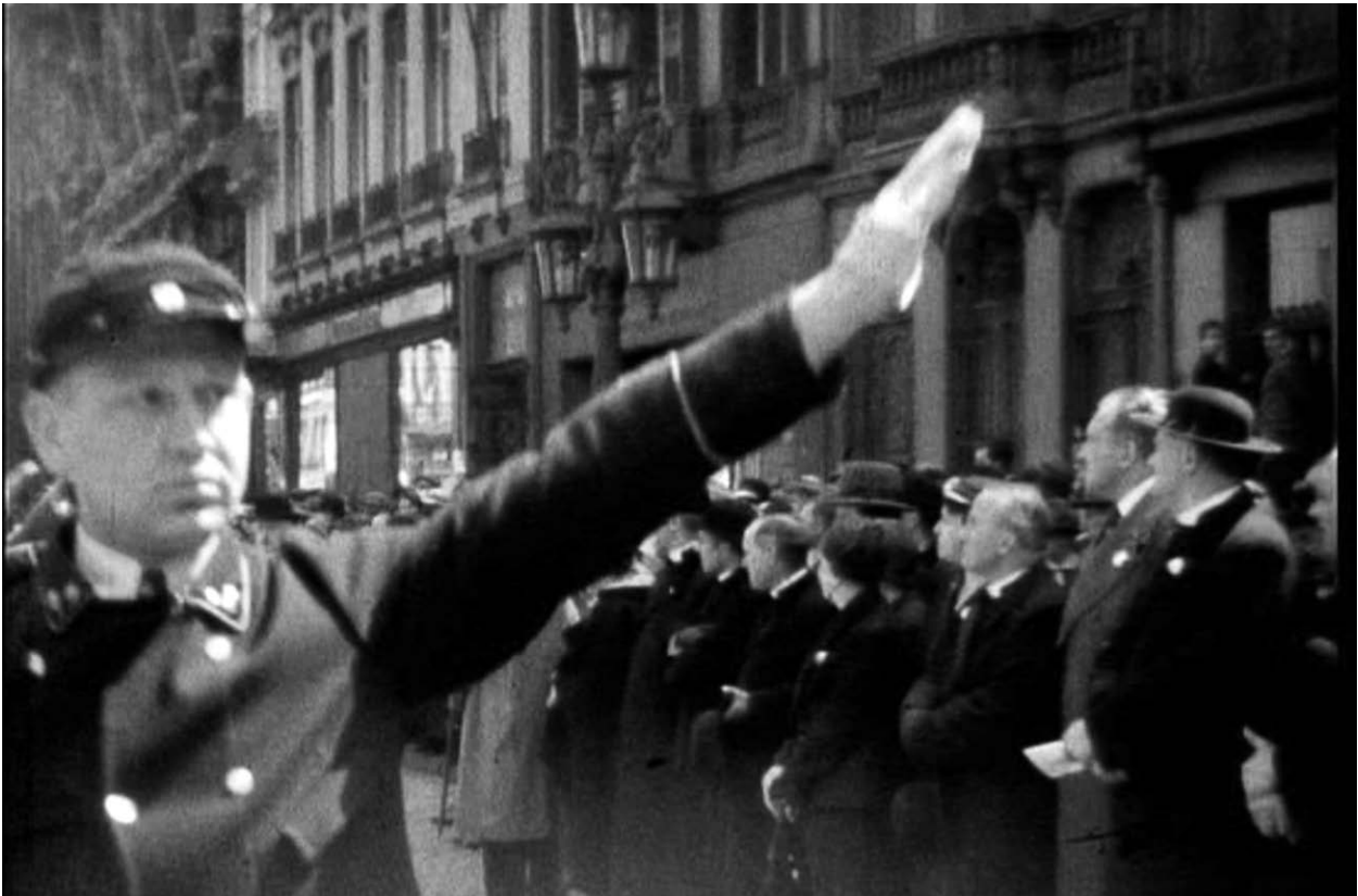
Still uit De Rerum Novarumstoet , Antwerpen, 1934, 03'06", groet met de linkerarm, vermoedelijk richting hoogwaardigheidsbekleders.