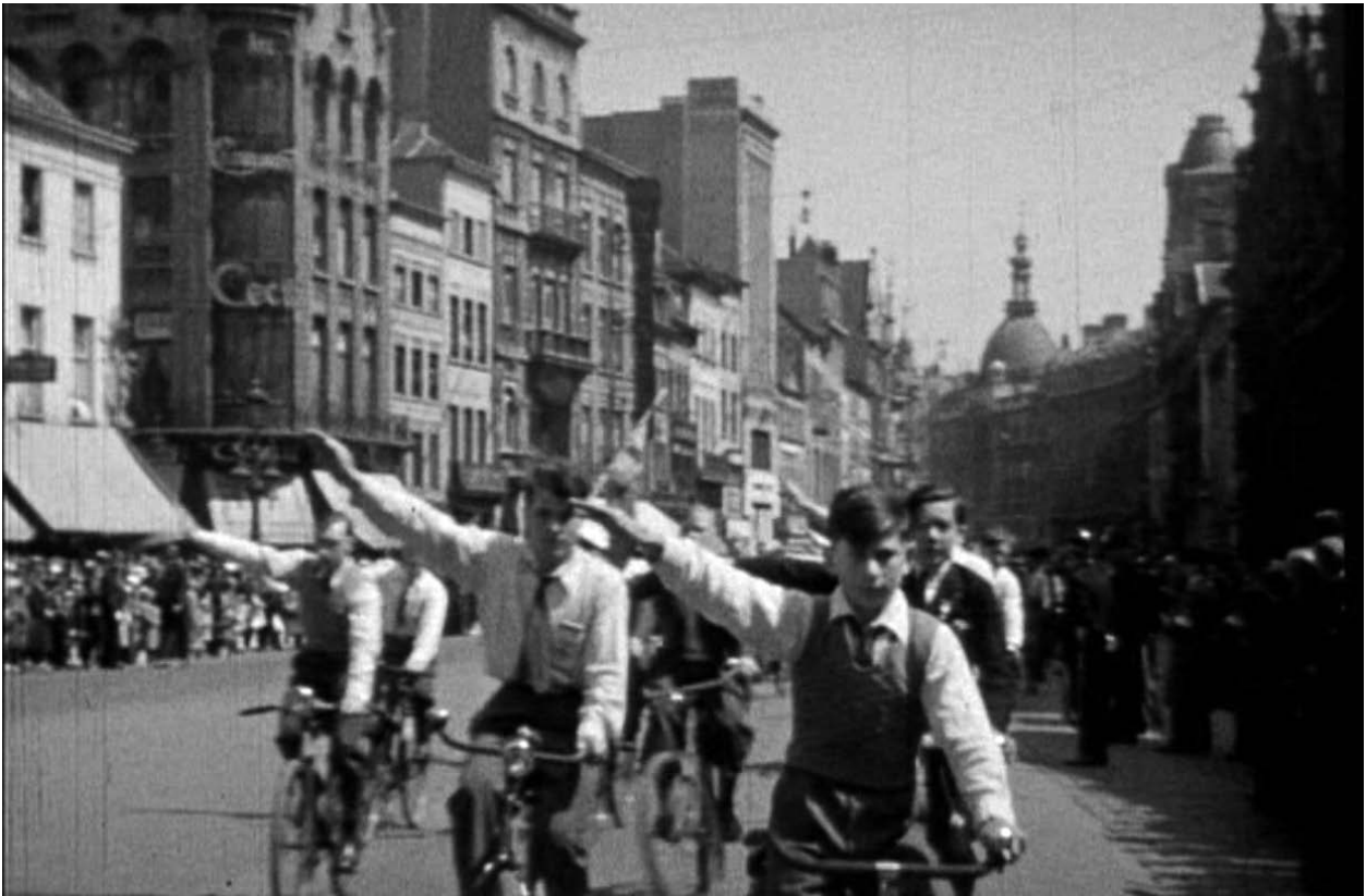
Still uit De Rerum Novarumstoet , Antwerpen, 1934, 06'13"