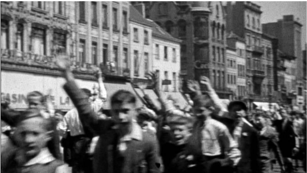
Still uit De Rerum Novarumstoet , Antwerpen, 1934, 04'06". Op deze still valt het niet te merken, maar op de filmbeelden zie je dat deze jongelui eigenlijk zwaaien. Zonder context loeren foute interpretaties om de hoek.