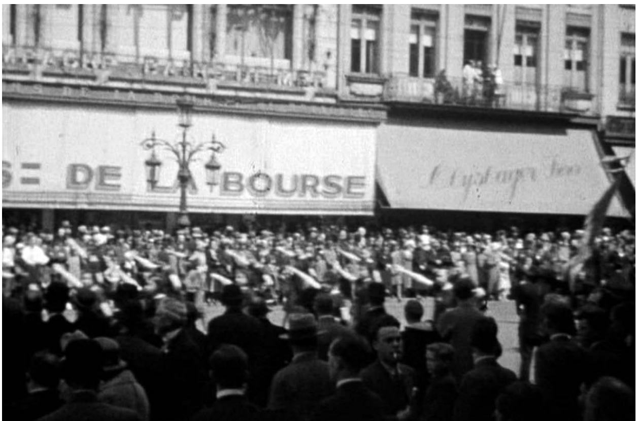
Still uit De Rerum Novarumstoet , Antwerpen, 1934, 04'56"