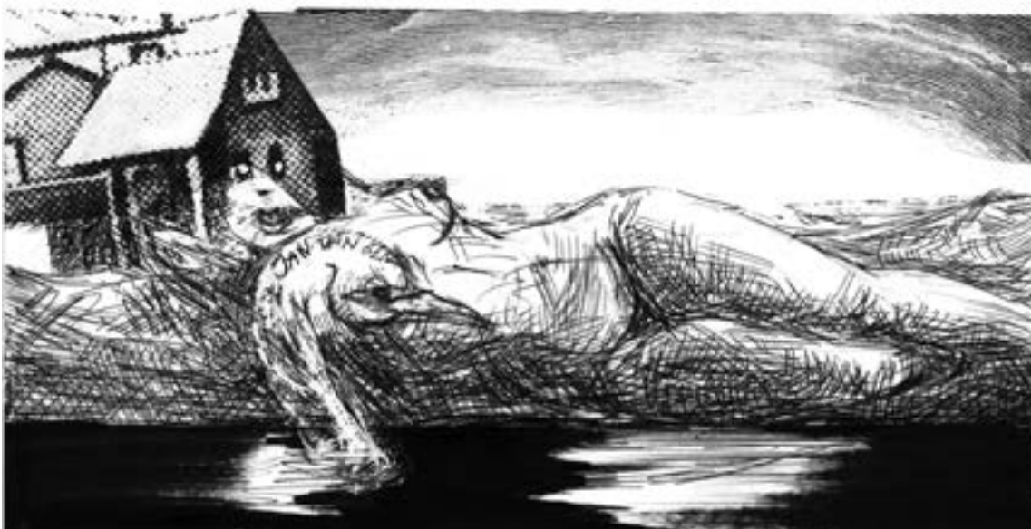
Land van het vuur en de jan- van-genten, Punta Arenas ligt open en bloot.