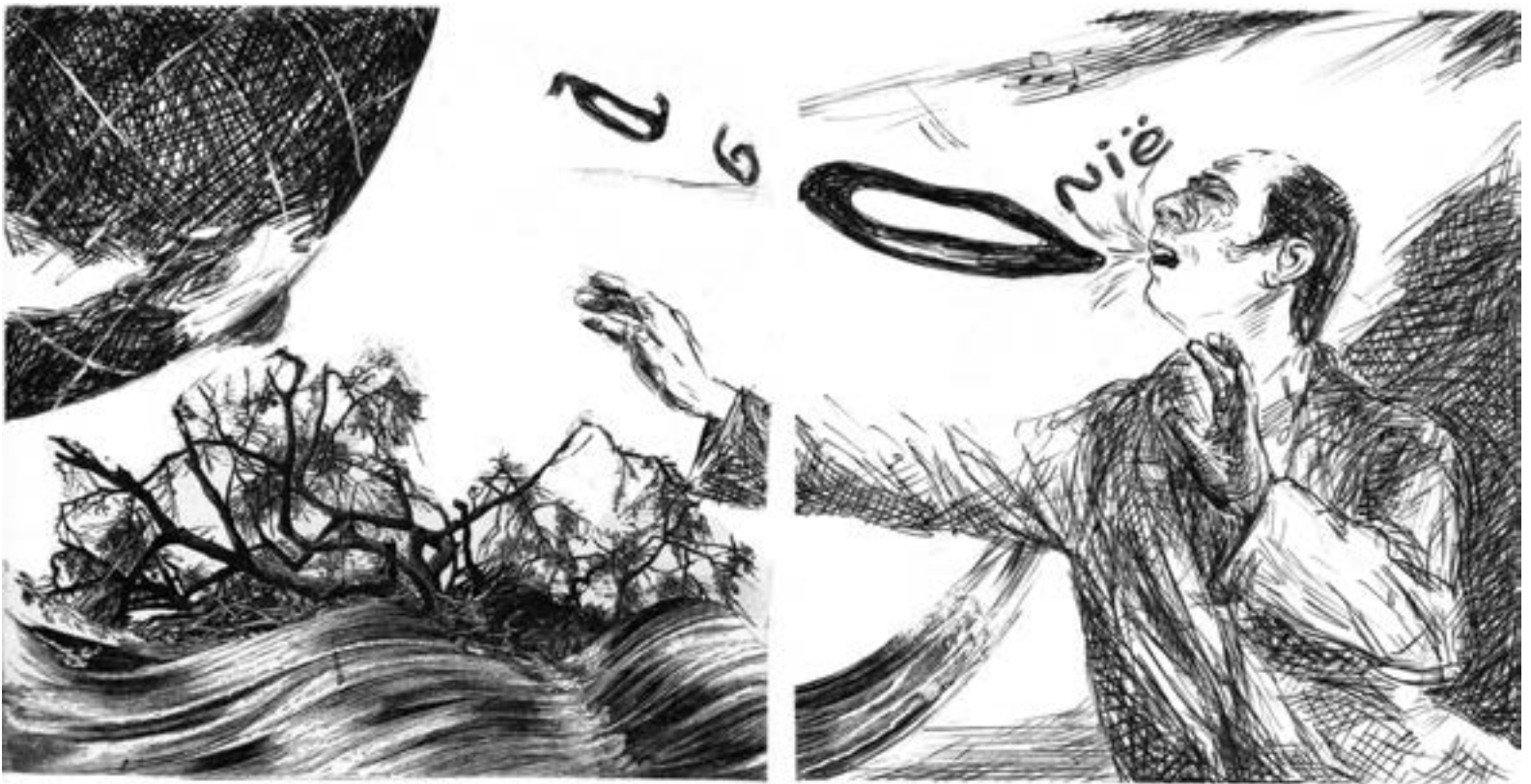
Land der natuur met haar vier elementen ver aan het einde der wereldkloot.